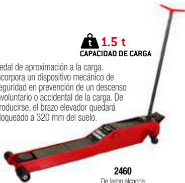
2460 De largo alcance